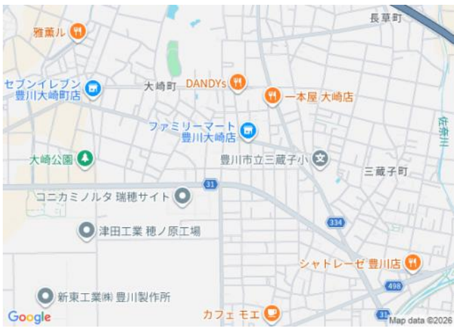
写真 東三河環状線へのカーアクセス良好。三蔵子小学校まで徒歩7分!