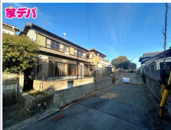
写真 図面と現況に相違ある場合には現況優先とします。