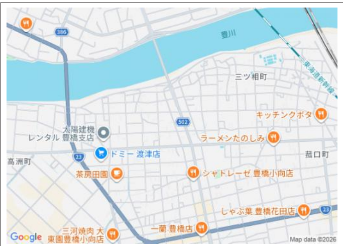
写真 【解体更地渡し】約246坪のゆとりある敷地!県道に出やすく、豊