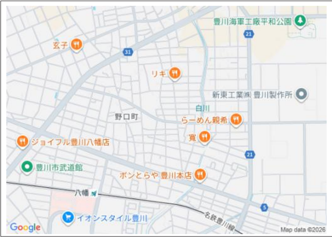
写真 土地面積201坪超。建築条件はありません。ご希望の建築会社が選