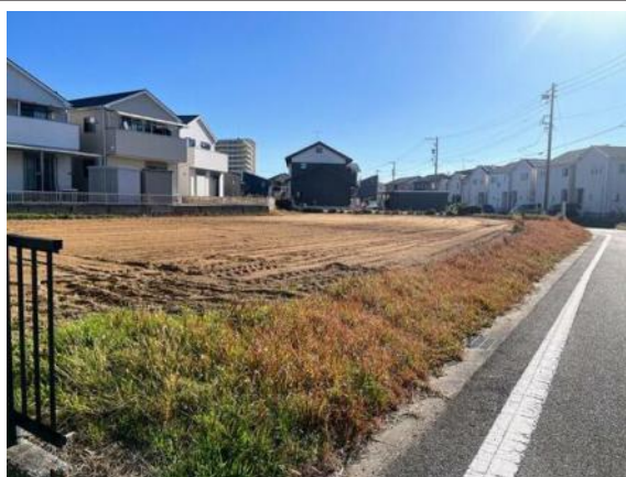
写真 図面と現況に相違ある場合には現況優先とします。