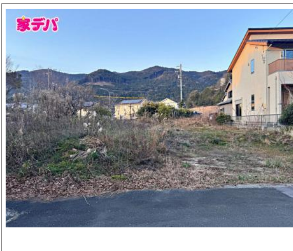
写真 図面と現況に相違ある場合には現況優先とします。