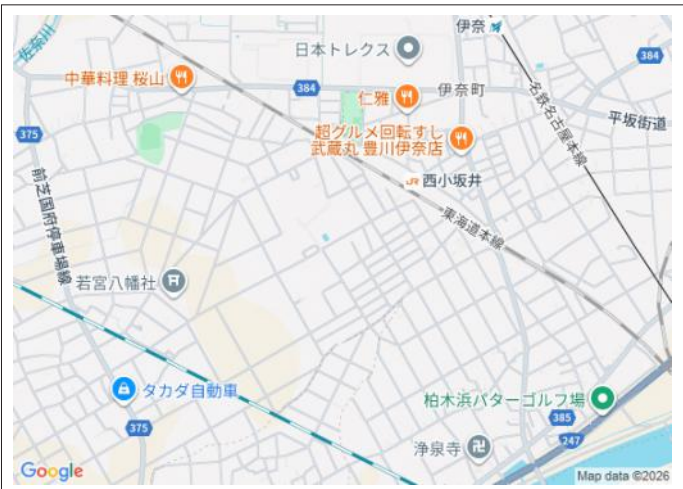
写真 小坂井西小学校(230m)