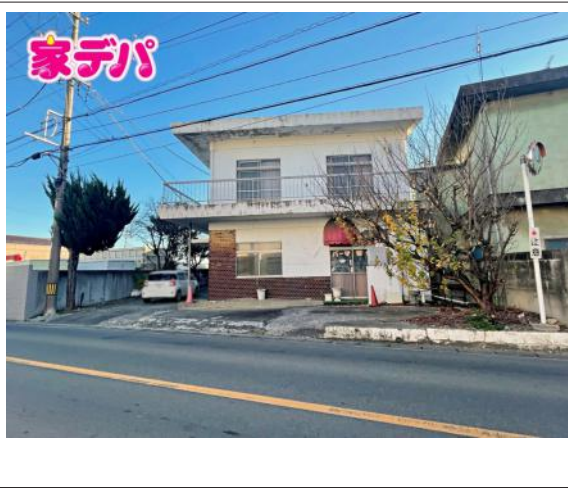
写真 図面と現況に相違ある場合には現況優先とします。