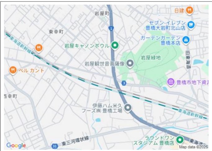
写真 【解体更地渡し】約184坪の広々とした敷地で、間口も約16.5mあ