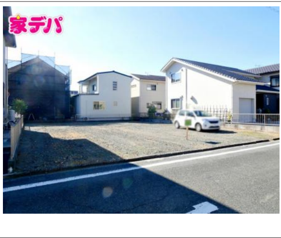
写真 図面と現況に相違ある場合には現況優先とします。