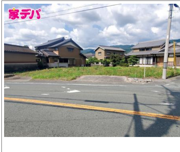
写真 1区画 図面と現況に相違がある場合は現況優先とします