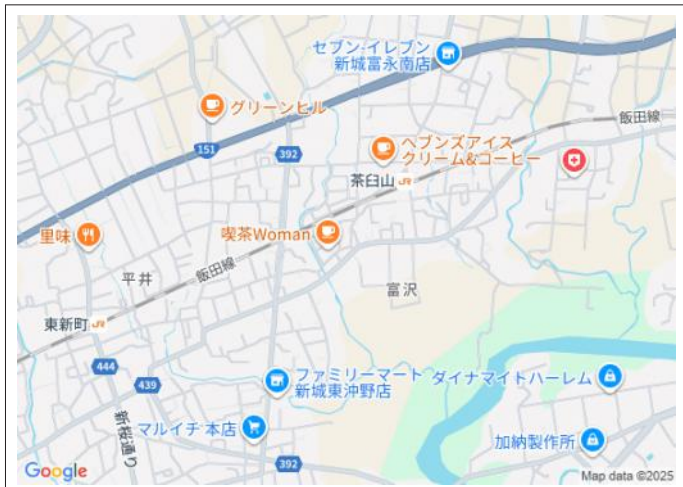
写真 建築条件ありません! 敷地面積60坪以上