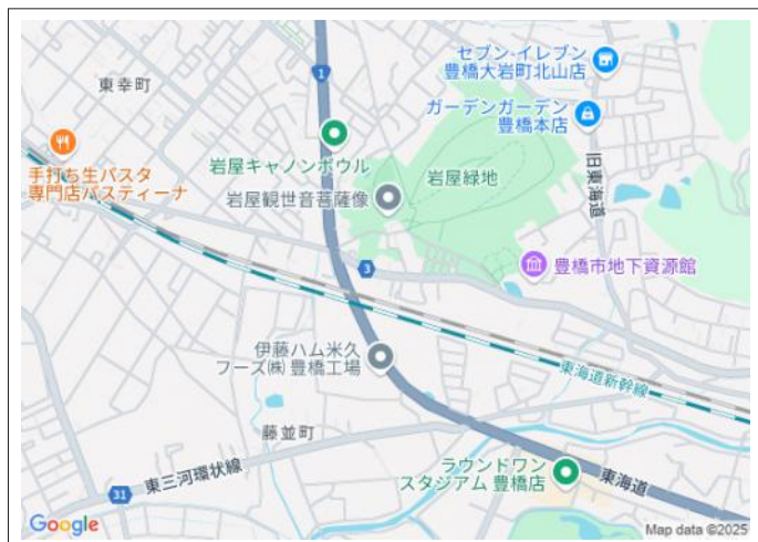
写真 【建築条件なし】立岩街道沿いで国道1号線へのアクセス良好!