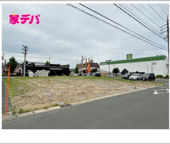
写真 3号地 図面と現況に相違がある場合は現況優先とします