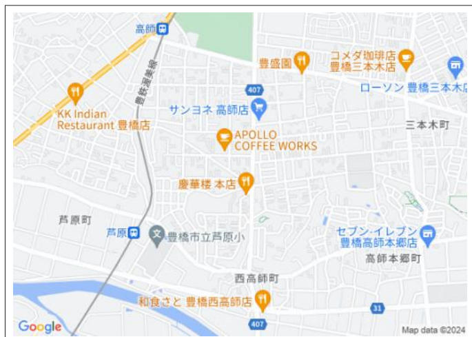
写真 建築条件なし!更地引渡します。南側道路で日当たり良好!芦原小学