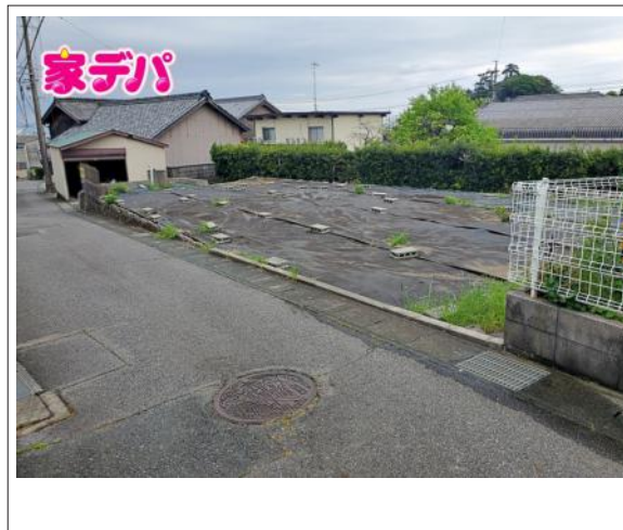
写真 図面と現況に相違ある場合には現況優先とします。