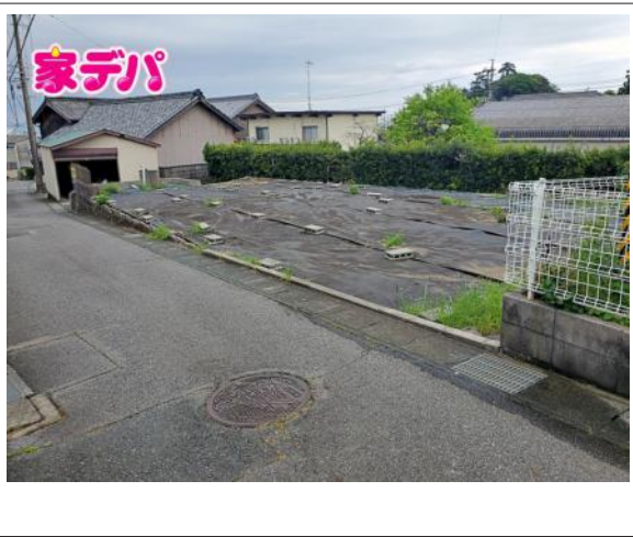
写真 図面と現況に相違ある場合には現況優先とします。