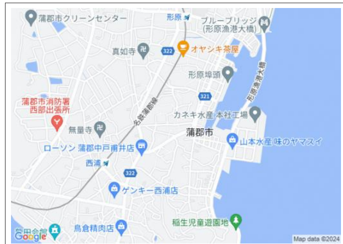
写真 名鉄蒲郡線「西浦」駅徒歩11分 名鉄蒲郡線「形原」駅徒歩11分