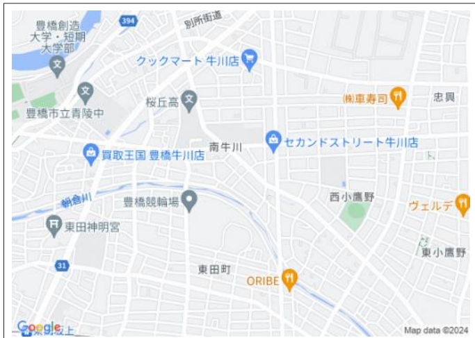
写真 【B号地】角地!建築条件が無くお好きなハウスメーカーを利用し