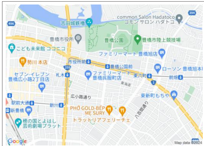
写真 建築条件なし、更地引渡し! 八町小学校まで徒歩約6分!