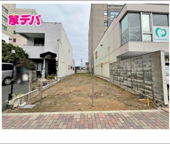
写真 図面と現況が異なる場合は現況優先となります