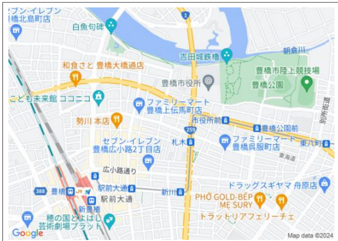
写真 23号線、1号線へアクセス良好。通勤やお出掛けに便利です!