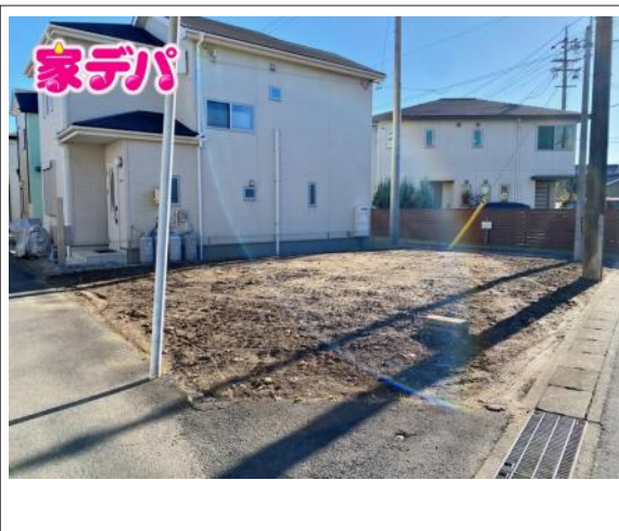
写真 建築条件無し!