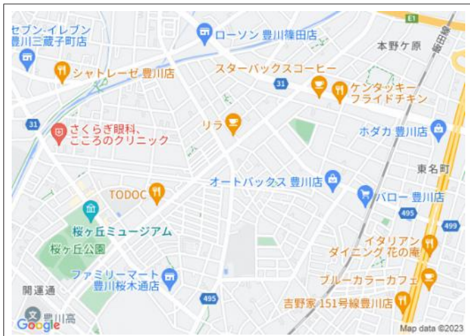
写真 3方向角地! 飯田線「豊川」駅まで徒歩15分!