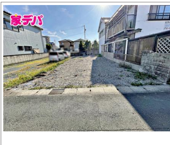
写真 建築条件なし