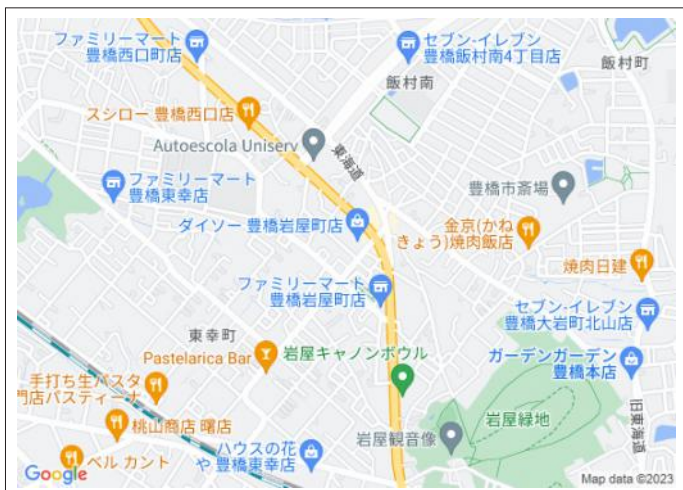
写真 ダイソー目の前!買い物便利です!国道1号線アクセス良好