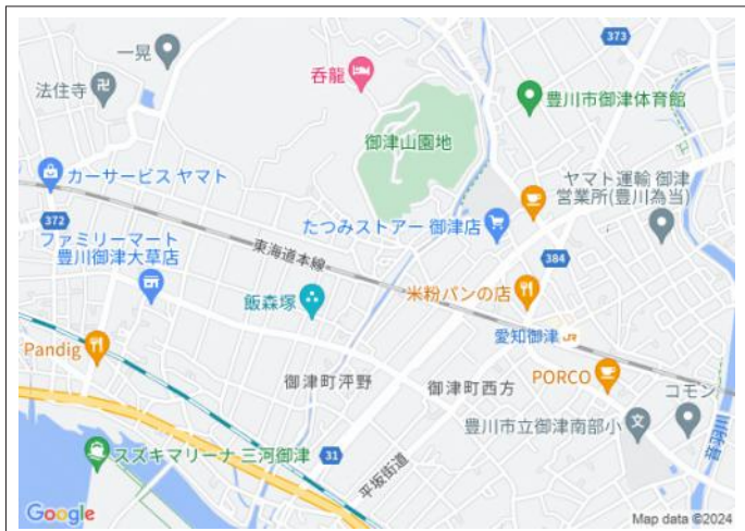
写真 JR「愛知御津」駅まで徒歩9分!通勤や通学も安心です。