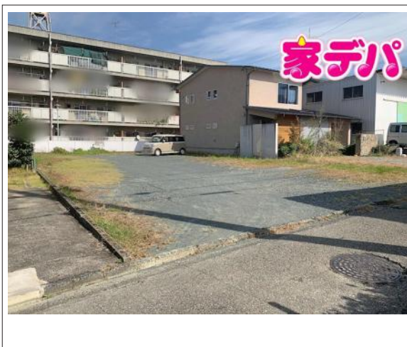
写真 建築条件なし