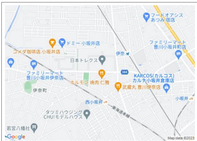
写真 名鉄「伊奈」駅徒歩7分、東海道線「西小坂井」駅徒歩11分!2路線