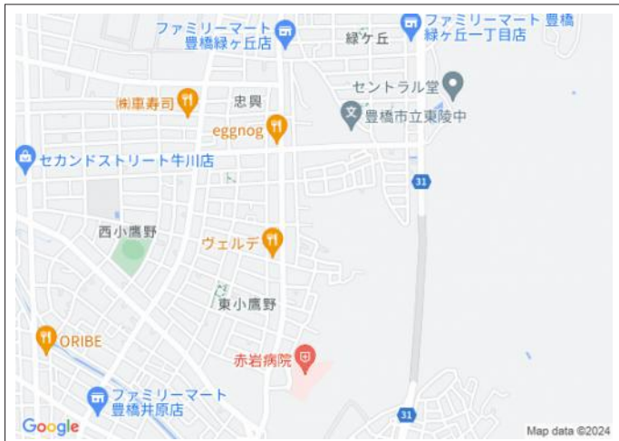
写真 牛川東保育園や鷹丘小学校が近く子育て世代にもオススメ!