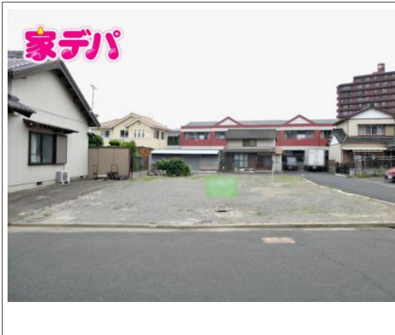
写真 建築条件なし