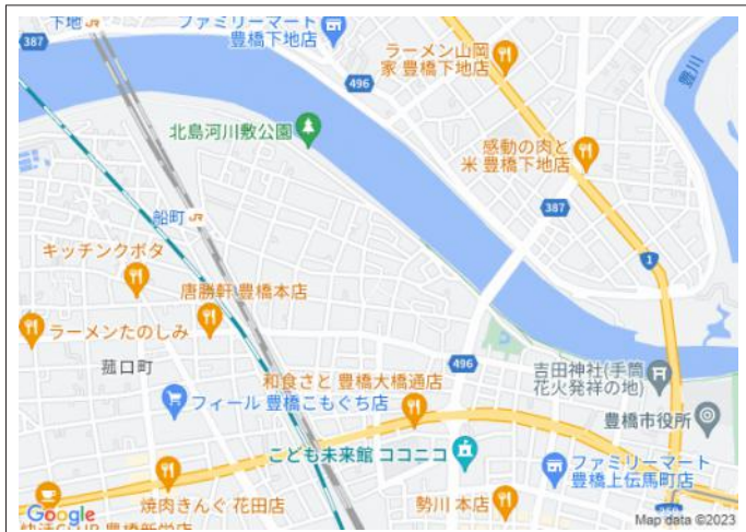
写真 ・敷地ゆったり63坪超 ・船町駅まで徒歩9分 ・建築条件なし