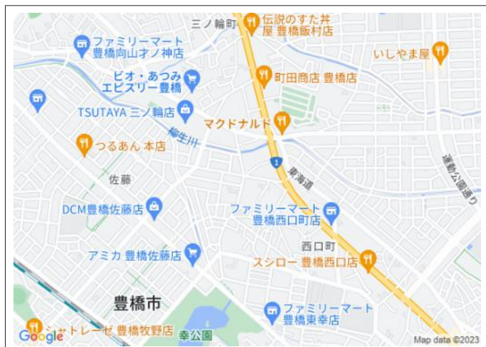
写真 角地!! 国道1号線へのアクセス便利。