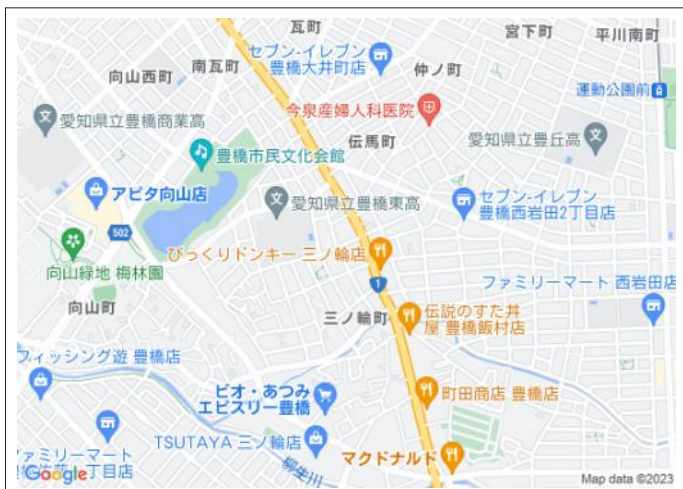
写真 交通アクセス良好!閑静な住宅地!