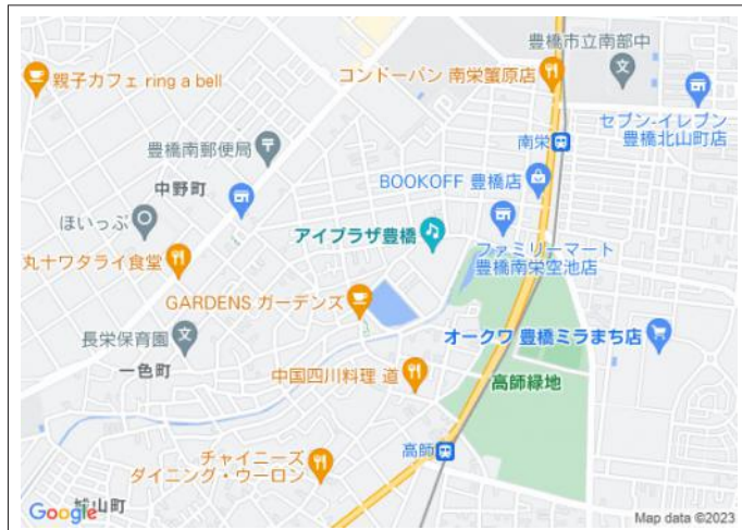
写真 高師緑地、徒歩圏内。