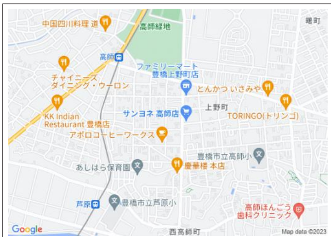
写真 サンヨネ高師店徒歩3分! 渥美線「高師」駅まで徒歩10分!