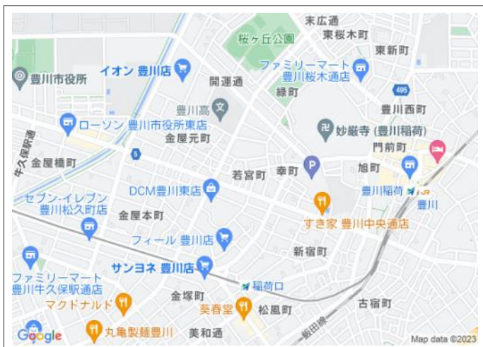
写真 建築条件はありません!ピアゴ豊川店・ドラッグオオオイが徒歩圏内!