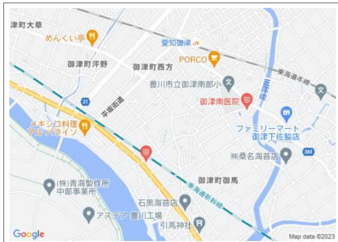
写真 更地引き渡し!建築条件無し!