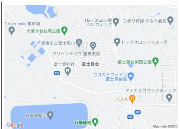
写真 小学校や公園が近く、子育て世代に嬉しい住環境!