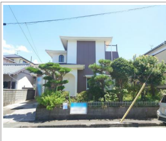
写真 【リフォーム後】3LDK