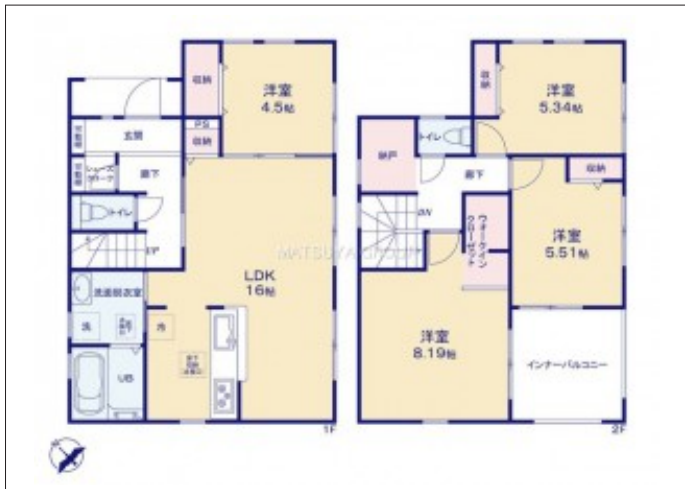
写真 【4号棟】完成予想図・4SLDK・LDK16帖、隣接洋室4.5帖