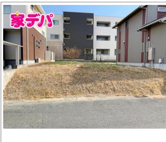
写真 図面と現況に相違ある場合には現況優先とします。